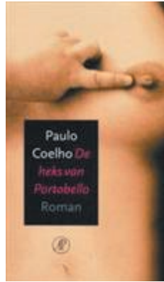
Paulo Coelho De heks van Portobello