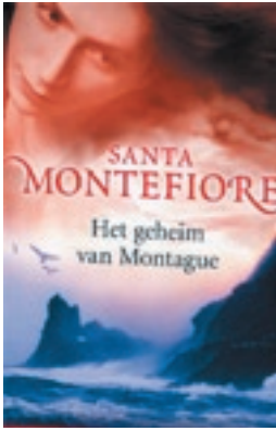
Santa Montefiore Het geheim van Montague