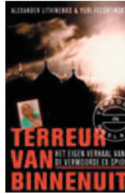
Alexander Litvinenko Yuri Felshtinsky Terreur van binnenuit