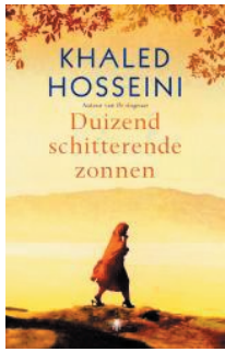
Khaled Hosseini Duizend schitterende zonnen