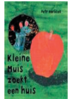
Petr Horáček Kleine muis zoekt een huis